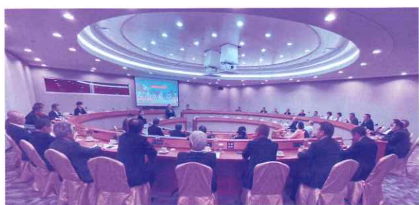
TAITRAとの意見交換会(世界貿易センター)

令和6年1月31日から2月3日の3泊4日の日程で、商工会長等37名が参加した台湾視察研修を行いました。台北市進出口商業同業公会 (IEAT) や 中華民國對外貿易發展協會 (TAITRA) など台湾を代表する経済団体を訪問し、今後の熊本と台湾における様々な産業分野での経済交流等について、有意義な意見交換を行う事が出来ました。