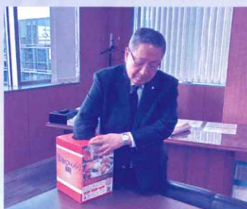
抽選会の様子(笠県連会長)

このキャンペーンは、期間中に被共済者1名あたり4口以上の新規加入もしくは増口された方を対象に、県下8事業所の魅力的な特産品等をプレゼントする企画で、当初の想定を上回る約200名のご応募をいただきました。