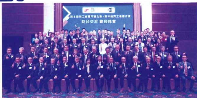
台北市のグランヴィクトリアホテルで開かれたIEATとの交流会

令和6年1月31日から2月3日の3泊4日の日程で、商工会長等37名が参加した台湾視察研修を行いました。台北市進出口商業同業公会 (IEAT) や 中華民國對外貿易發展協會 (TAITRA) など台湾を代表する経済団体を訪問し、今後の熊本と台湾における様々な産業分野での経済交流等について、有意義な意見交換を行う事が出来ました。