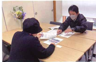
3月5日 能登町商工会 相談室