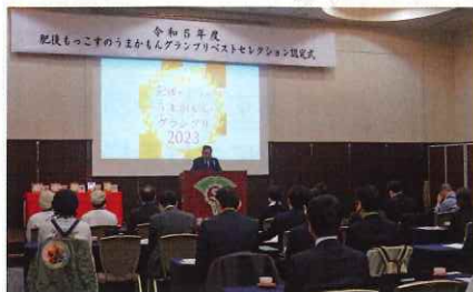
ベストセレクション認定式会長挨拶

令和6年1月18日「肥後もっこすのうまかもんグランプリベストセレクション」認定式を行いました。笠会長から認定証を授与し、受賞事業者から受賞の喜びや開発に至った経緯や想いなどを発表して頂きました。