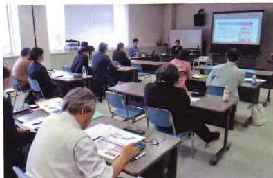
2月16日 中能登町商工会 研修室