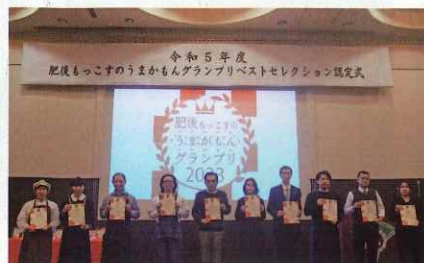
ベストセレクション認定証受賞者